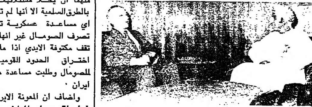
سمو السيد فهد آل سعيد لدى استقباله الدكتور سعادت

استقبل سمو السيد فهد آل سعيد وزير الاعلام والثقافة بمكتبه صباح السبت الماضي سعادة الدكتور فتح اللسعادت وكيل وزارة الاعلام والسياحة الايرانية للشؤون البرلمانية والذي يزور البلاد حالياً بدعوة من وزارة الاعلام والثقافة.